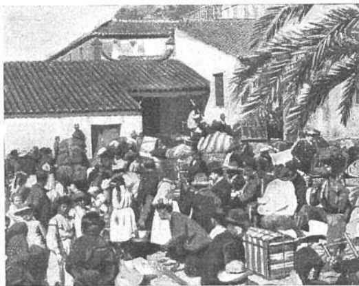
Los emigrantes en el patio de la casa donde se alojaron durante su estadía en Málaga