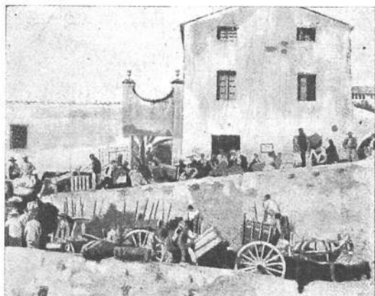
Disponiendo sus equipajes para embarcar en el «Heliópolis»

Con objeto de colonizar el archipiélago de Hawai y substituir con europeos á los japoneses, los Estados Unidos han contratado recientemente en Andalucía 850 familias, componiendo un total de 3,823 personas. Para conducir las á Hawai llegó últimamente á Málaga el vapor «Heliópolis».